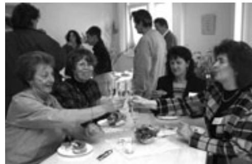
Einweihungsfeier im Anwohnertreff „Krümelkiste“

mit Nachbarn und Freunden zu treffen, ihre Freizeit interessant und vielseitig zu gestalten und an den Angeboten teilzunehmen.