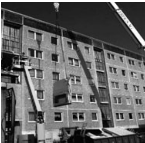
Demontage der Wand im Treppenhaus. Hier entstand der Zugang zum Fahrstuhl.

Um die langfristige Akzeptanz des Wohnungsbestandes zu sichern, haben wir im Jahr 2004 in der Hermann-Matern-Straße 72 - 89 eine für Neuruppin bisher einmalige Baumaßnahme realisiert: den Anbau von 18 Personenaufzügen!