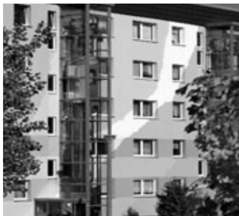
Farbgestaltung am Wohnhaus Hermann-Matern-Straße 78

Das viel diskutierte Farbprojekt findet nach Fertigstellung breiten Anklang. Nicht nur unsere Mitglieder und Mieter sind mit den „Farbfluten“ zufrieden, auch in der Öffentlichkeit wird das Projekt als gelungene Belebung des Wohnstandortes gewertet. Was noch fehlt, ist die Neugestaltung des Wohnumfeldes.